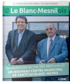
Le Blanc Mesnilois N°208