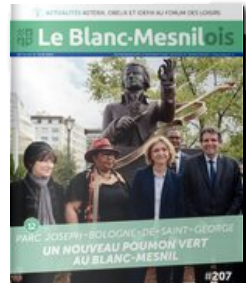
Le Blanc Mesnilois N°207