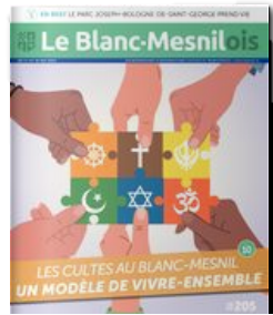
Le Blanc Mesnilois N°205